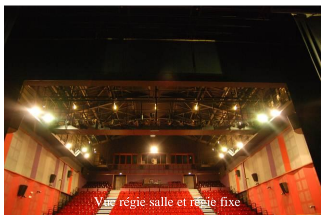
Vue régie salle et régie fixe